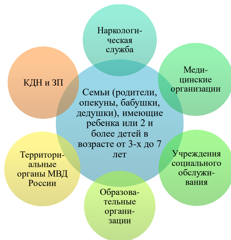
Рисунок 3. Межведомственное взаимодействие субъектов профилактики

Между субъектами межведомственного взаимодействия существует разделение зоны ответственности (рис. 3). Примером может послужить профилактическое взаимодействие, выстроенное в городе Москве (табл.2).