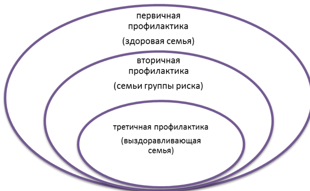
Рисунок 2. Виды профилактических вмешательств

Цель первичной профилактики – заложить приоритет здоровья в традиции семьи, воспитывающей ребенка дошкольного возраста, сформировать активное противостояние потреблению ПАВ всеми членами семьи.