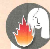
Находиться у костра с распущенными волосами