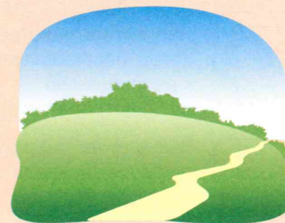
Найдите поляну, защищенную от ветра