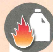
Лить в костер горючие жидкости