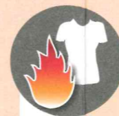
Приближаться в синтетической одежде