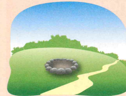
Очистите место от сухой травы и листьев, (зимой — от снега), обложите камнями