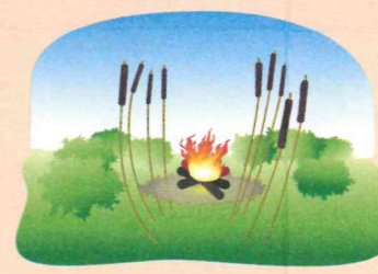
В зарослях сухого камыша