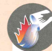
Оставлять костер непотушенным

В московских парках и скверах можно устраивать пикники на всей территории, кроме заповедных и коммерческих участков.